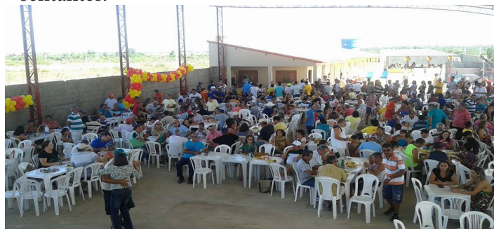
Festas e nova área de lazer do SINTSEF/RN.