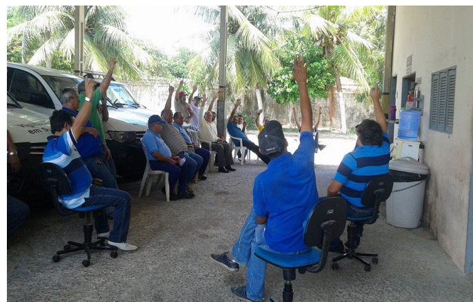
Assembleias por Local de Trabalho e eleição de representantes.