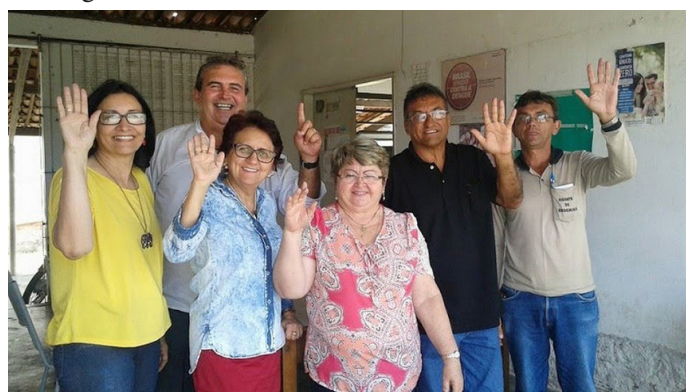
Assembleias por Local de Trabalho e eleição de representantes.