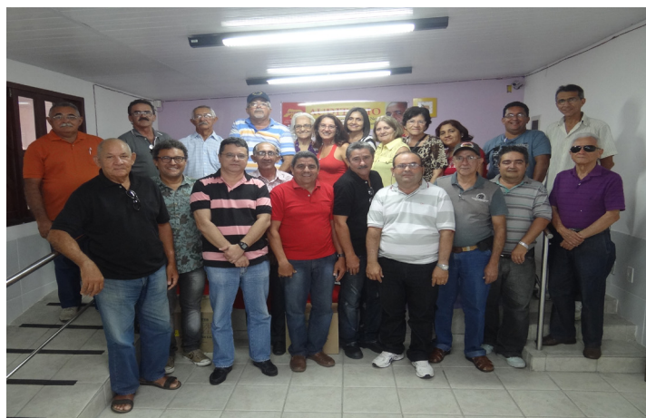
Posse da gestão 2014/2017: “Seguir adiante: se muito vale o já feito, vale mais o que virá”.