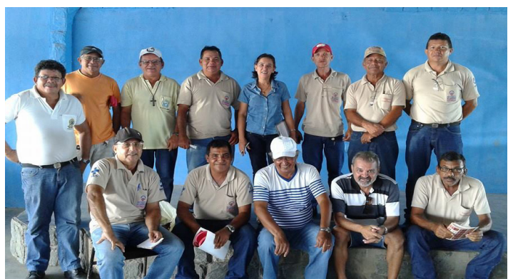
Assembleias por Local de Trabalho e eleição de representantes.