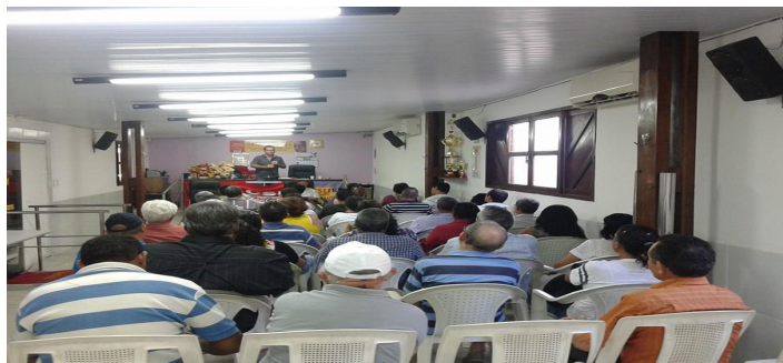
Reuniões com filiad@s dos órgãos representados pelo SINTSEF/RN.