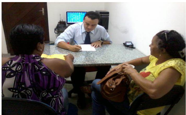
Plantões jurídicos para @s filiad@s.